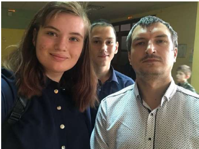
С любимым учителем истории

В честь начала нового учебного года редакция газеты «ДАР» объявила о проведении конкурса «Селфи с любимым учителем»! В следующие несколько недель на наш почтовый адрес пришло множество фотографий, и теперь мы публикуем лучшие из них!