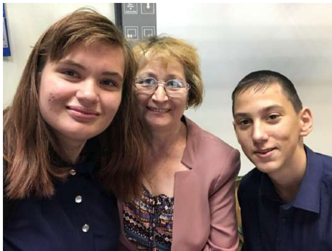
С любимым учителем биологии