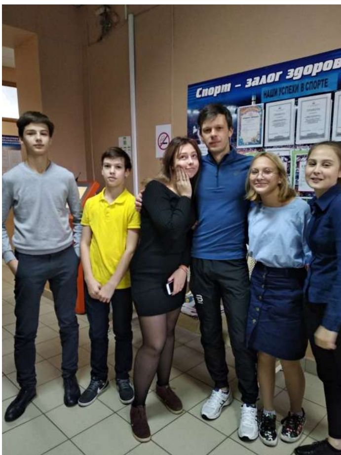
С любимым учителем физкультуры